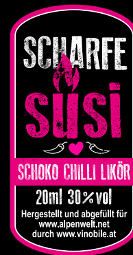
SCHARFE SUSI 2 cl 5.00