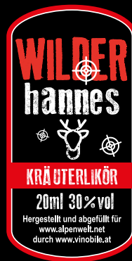
WILDER HANNES 2 cl 5.00